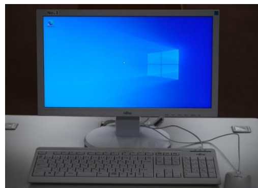
インターネット閲覧パソコン